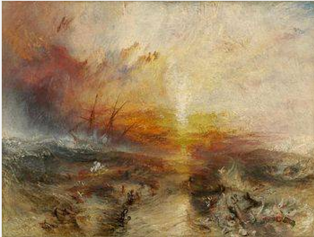
The Slave Ship – J.M.W. Turner